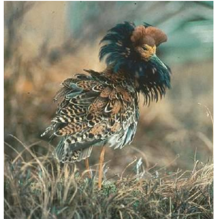
Ruff, Finland.